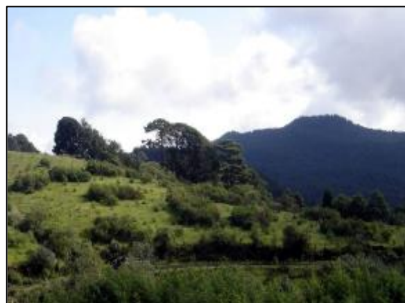
Figura 2. Vista panorámica de un ensayo de restauración en un campo agrícola abandonado. Los manchones de Lupinus elegans tienen 2 años de edad y bajo su dosel se encuentran la mayoría de los árboles supervivientes de Abies religiosa .

Una estrategia que resulta prometedora es el uso de especies nativas que actúen como nodrizas y mejoren la fertilidad del suelo. En nuestro caso, Lupinus elegans , una leguminosa nativa, cumple estas dos funciones, al incrementar las concentraciones de nitrógeno e incrementar la supervivencia y crecimiento de Abies religiosa , una especie sucesional tardía tolerante a la sombra que difícilmente se establece en sitios abiertos, así como facilitar el establecimiento de especies nativas del sotobosque (Figura 2).