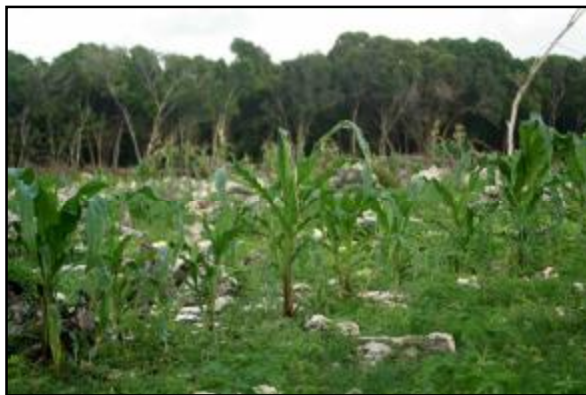
Figura 1. Plantación de maíz ( Zea mays ) en conuco hecho en el bosque siempreverde micrófilo.

La actividad que más afecta al bosque siempreverde de Caletones es la tala para la implantación de parcelas de cultivos conocidas comúnmente como conucos (Figura 1). Después que los suelos han perdido su fertilidad los conucos son abandonados y colonizados por matorrales secundarios (Figura 2), que garantizan