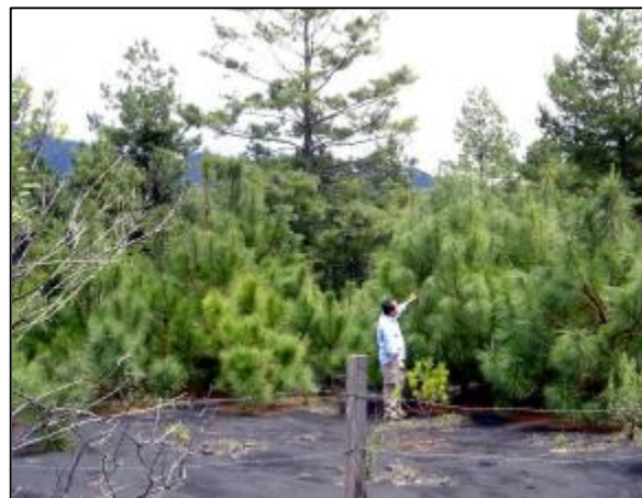
Figura 1. Ensayo de restauración en un arenal de ceniza volcánica 4 años después de que se plantaron los árboles. Todos los árboles supervivientes fueron protegidos con acolchado.

Con esta información se inició una segunda etapa que consistió en experimentos de restauración, en una localidad, para probar el efecto del uso de acolchados (adicionar una cubierta de origen vegetal -como corteza de pino- alrededor de la planta, para disminuir la temperatura de la superficie y favorecer la retención de humedad del suelo) en la supervivencia de especies nativas del dosel arbóreo como Pinus pseudostrabus y P. Montezumae (Figura 1).