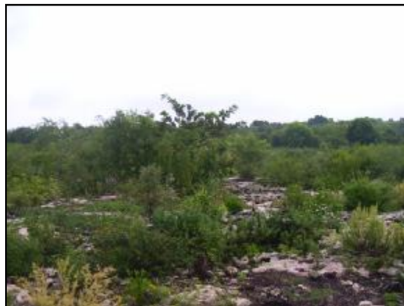
Figura 2. Matorral secundario en un conuco abandonado.

la restauración de la vegetación en el presente trabajo nos hemos propuesto dar respuesta a las dos preguntas siguientes: ¿Qué diferencias existen -en cuanto a composición de especies y a número de individuos por especie- entre los matorrales que se implantan en conucos de diferentes edades de abandono en la localidad de Caletones? y ¿Existe similitud florística entre los matorrales de los conucos con diferentes edades de abandono y el bosque siempreverde micrófilo circundante?.