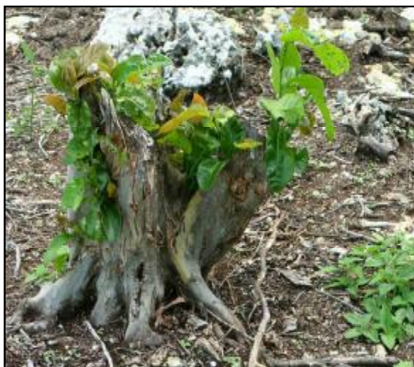
Figura 4. Tocón de Coccoloba diversifolia rebrotando.

Lysiloma latisiliquum muestra un comportamiento interesante en el caso de los conucos con 8 y 10 años de abandono, ya que en las parcelas de estos fueron inventariados 46 árboles de esta especie lo que indica que la misma se comporta como oportunista. Esta especie es de rápido crecimiento y es muy frecuente en bosques secundarios de localidades cercanas a Caletones.