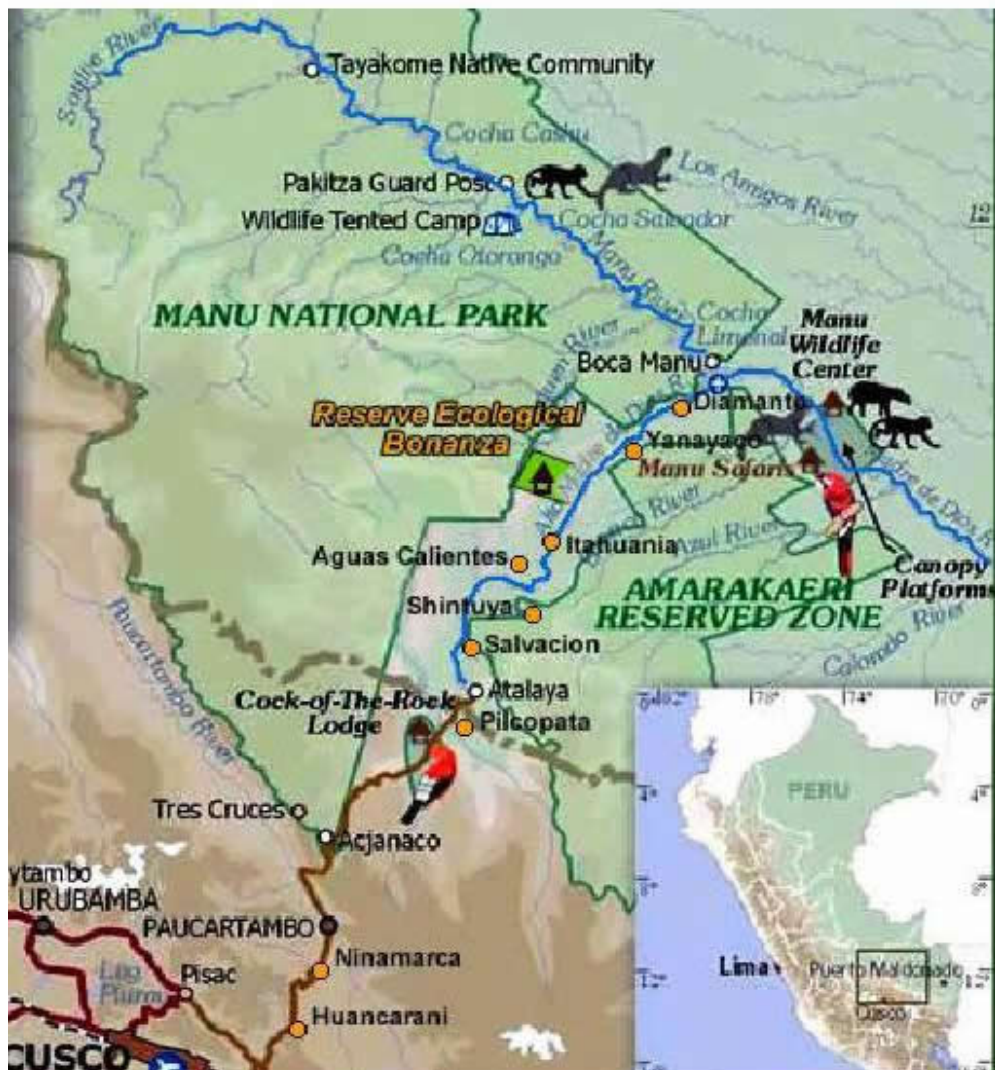
Mapa 2 Zona de Visita Cusco-Itahuania- Shipitiani-Cusco

Por su riqueza biológica y cultural, en 1977 el PNM junto con otras áreas contiguas, fue declarado por el Programa El Hombre y la Biosfera de la UNESCO, como Reserva de Biosfera Manu (RBM), con una extensión de 1.881.200 ha. La RBM es la más grande de las Reservas de Biosfera en la Amazonía. Posteriormente, en 1987, la misma UNESCO incorporó al PNM en la lista de Patrimonio Natural de la Humanidad.